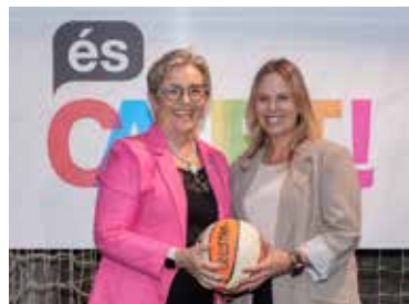
L'alcalde i la seva regidora d'Esports