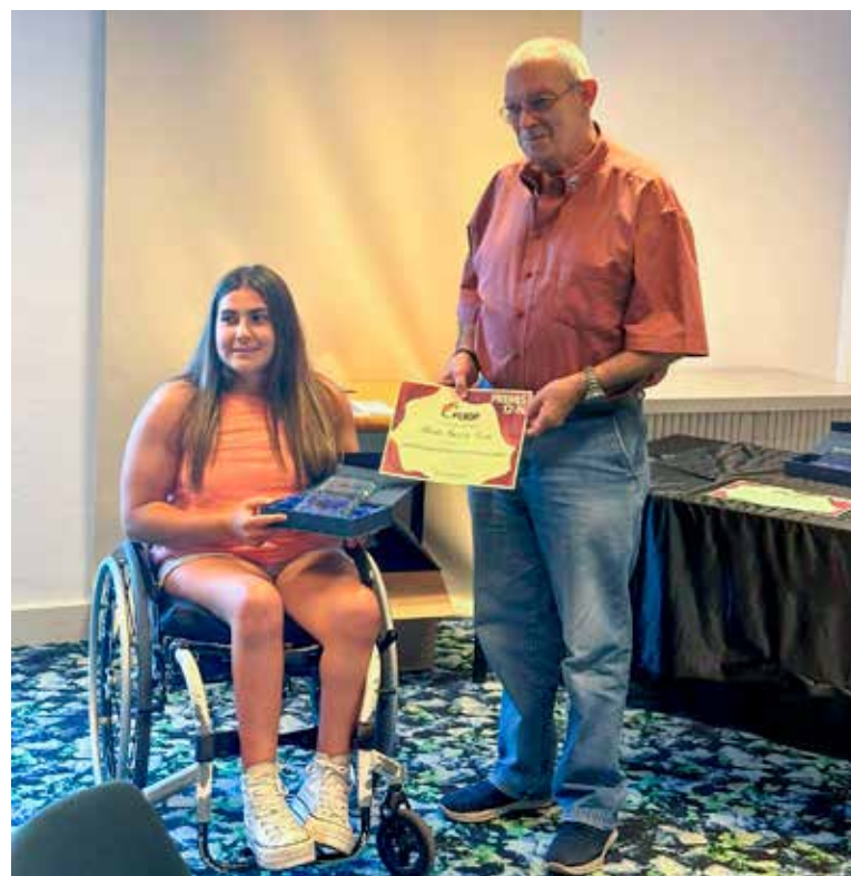
El president de la Federació Catalana d' Esport Adaptat li fa entrega del premi a la millor esportista del 2024

Vilassar de Mar és un poble preciós, on es viu molt bé, així que em puc considerar afortunada de poder-hi viure. És on ho tinc tot: família, amics, infància, adolescència... Exerceixo de vilassarenca.