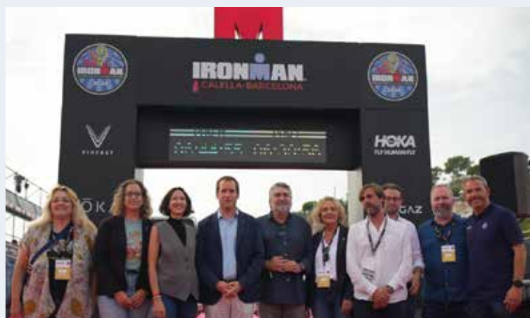
Des de la sortida del sol fins ben entrada la tarda, 3.200 triatletes de més de 90 països van convertir Calella i el Maresme en l'epicentre del triatló mundial

i familiars, amb el lema "YOUR DREAM START HERE", abans d'entrar a l'aigua de la mar Mediterrània per superar la secció de natació. Una vegada a la platja, el segment de ciclisme va introduir la gran novetat, el fet que els triatletes es van acostar més que mai a la ciutat de Barcelona, en un circuit de dues voltes que va recórrer totes les poblacions costaneres del Maresme i que es va caracteritzar per ser molt ràpid sobre l'asfalt de l'N-II. El circuit de carrera a peu també es va renovar, ja que en lloc de fer-ho tot en el clàssic tram del passeig de Mar des de Calella fins a Pineda de Mar s'hi va afegir una secció que va passar pels carrers de Calella, on l'encant dels carrers, el públic, els bars i la música van crear un ambient molt especial per animar els atletes. Finalment, l'arribada va tenir lloc sota l'espectacular 'finish line' de tot el continent europeu, on es van instal·lar unes graderies plenes de seguidors per rebre tots