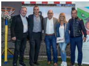
Representants de l'FCF i la presidenta del Canet FC