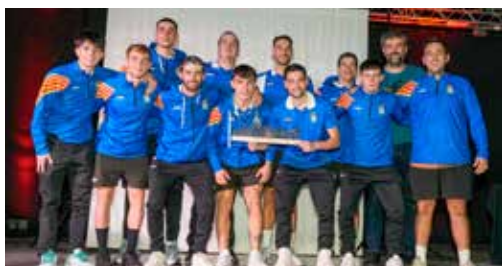
CANET FS SENIOR